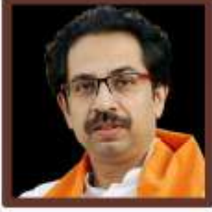
श्री. उद्धव ठाकरे माननीय मुख्यमंत्री