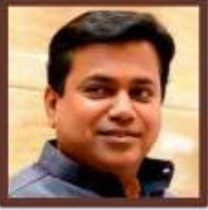
श्री. उदय सामंत मंत्री उच्च व तंत्रशिक्षण