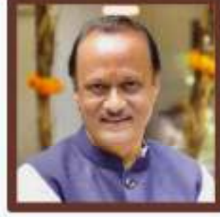
श्री. अजित पवार माननीय उप मुख्यमंत्री